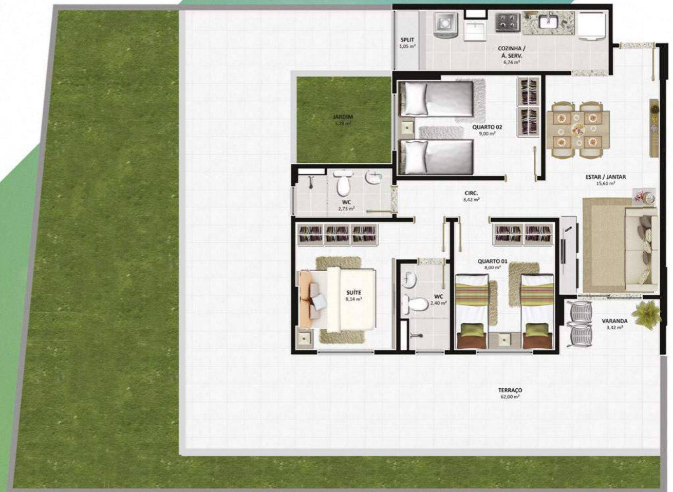
TORRE: PARC | COLUNA: 05