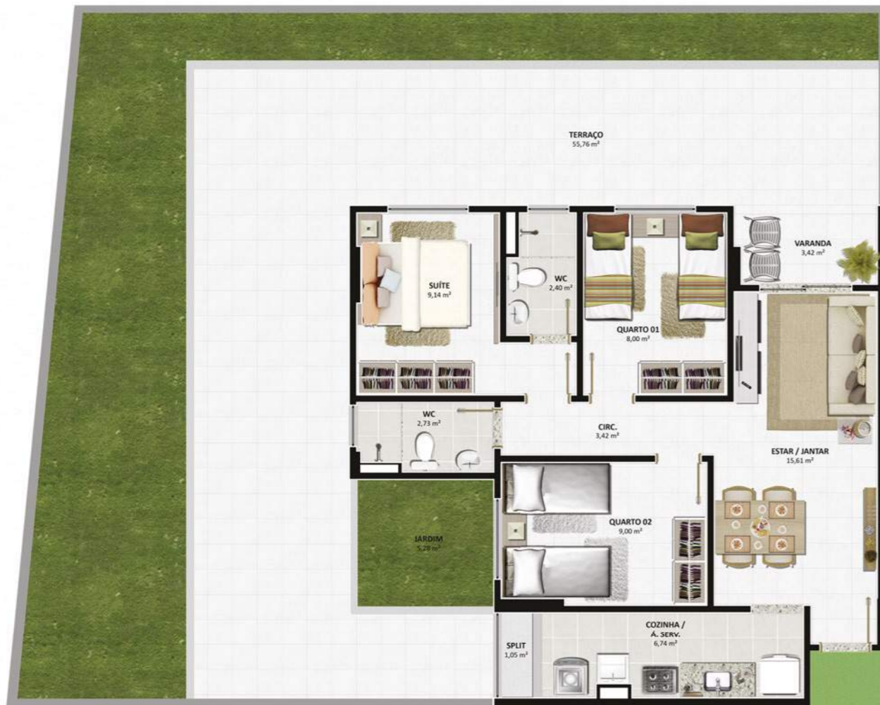
TORRE: JARDIM | COLUNA: 06